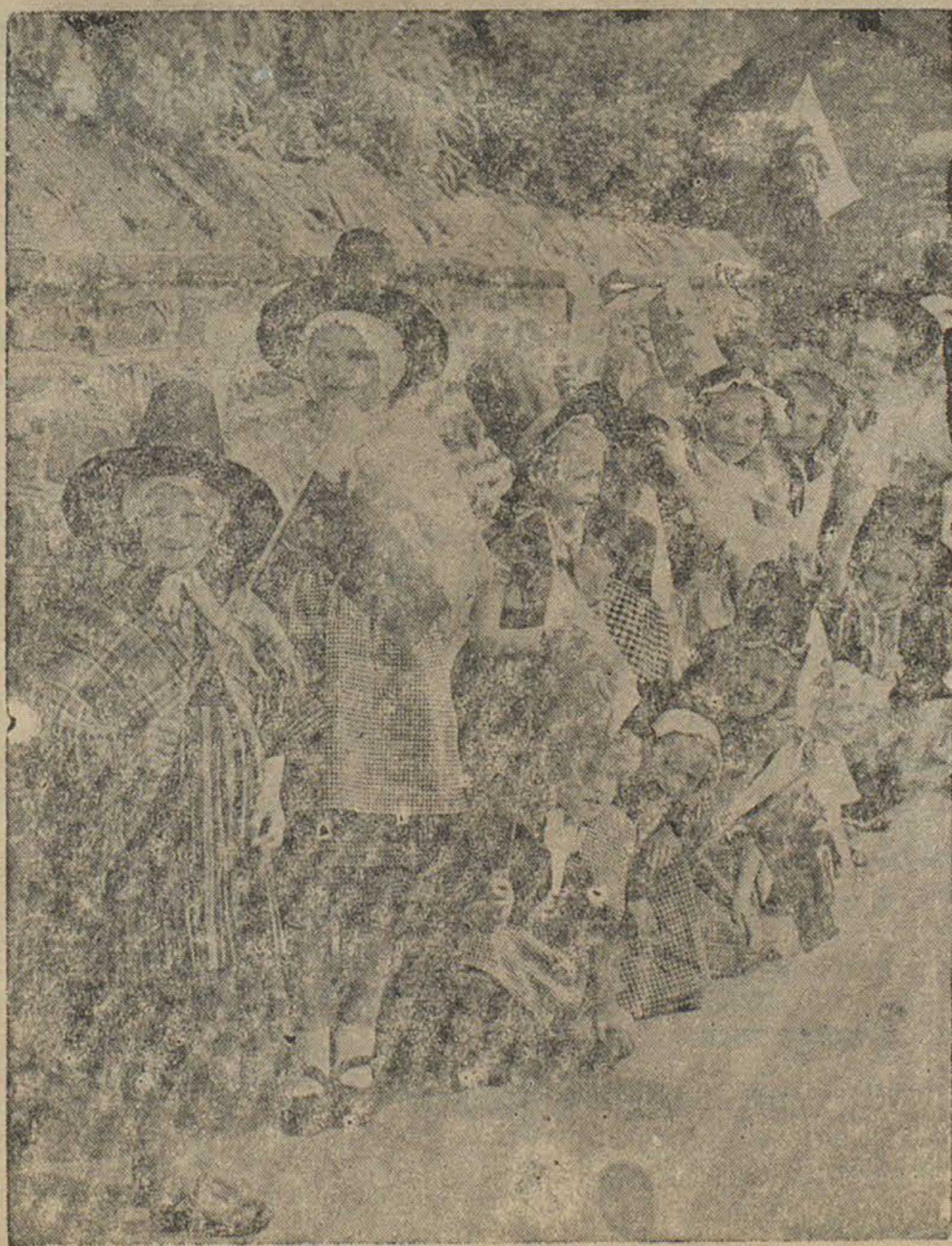
Momento alusivo para las Fiestas Florales de la Juventud

El premio mayor codiciado, el que para estos momentos ya debe tener su