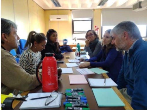
Figura 2: Trabajo en grupos.