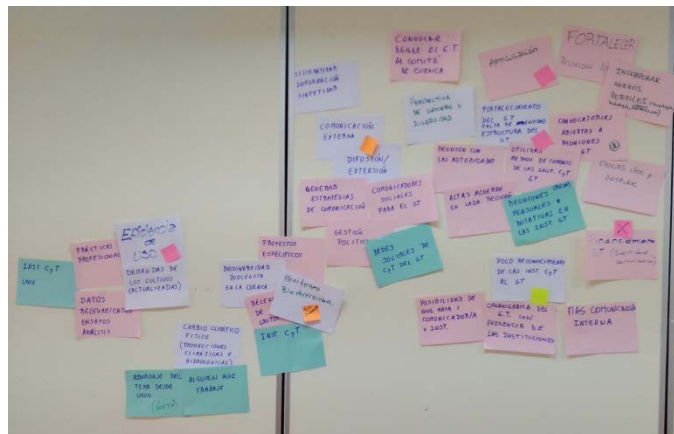
Figura 4: Áreas de vacancia agrupadas según similitudes e identificadas según grado de priorización.

Dentro de las áreas de fortalecimiento predominaron las de comunicación interna y externa, ya que permitirían la articulación de actividades con otros grupos y posibles nuevos integrantes (Tabla 2). Por otro lado, dentro de las grandes temáticas, se destacó que tanto el balance hídrico como el monitoreo de caudal y calidad del río (contenidos de agroquímicos y antibióticos) requieren esfuerzo constante (Tabla 2). También, se mencionó la necesidad de profundizar en algunos aspectos de la cuantificación y el mapeo del uso del agua así como de la gobernanza. En la discusión plenaria se identificaron tres áreas adicionales transversales a los proyectos y áreas de vacancia: visión de cuenca, perspectiva de género y diversidad, y adaptación.