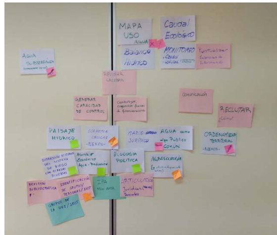
Figura 5: Áreas de vacancia agrupadas según similitudes e identificadas según grado de priorización.

Para organizar la agenda de trabajo del GT, se priorizaron las áreas y acciones relativas al fortalecimiento, algunas áreas de vacancia generales y otras temáticas abordadas por proyectos de algunos integrantes (Tabla 2). A mediano y largo plazo se planean abordar temáticas que requieren articulación o incorporación de otros especialistas en el GT (Tabla 2, Fig. 2 y 3). Es necesario mencionar, que varias de las áreas identificadas como “urgentes” están siendo abordadas en proyectos en ejecución.