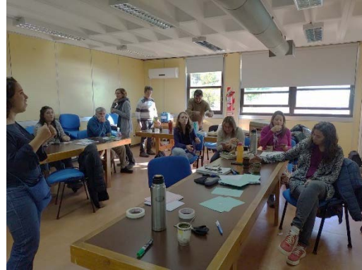
Figura 3: Puesta en común y discusión plenaria.